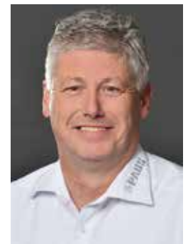
Klaus Helming Hermann Paus Maschinenfabrik GmbH