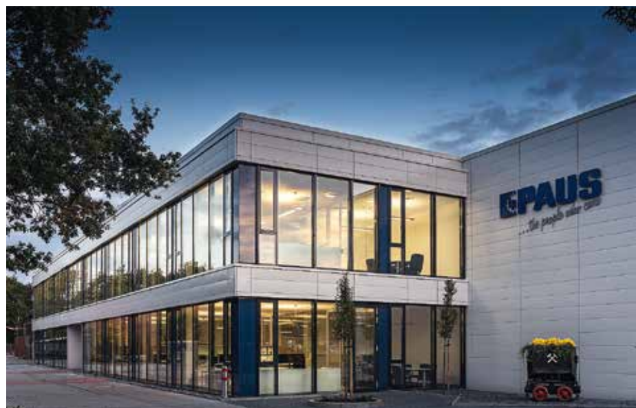
Abb. 1: Hermann Paus Maschinenfabrik GmbH