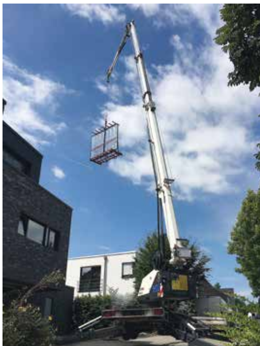
Abb. 2: der Anhänger- kran PTK 31